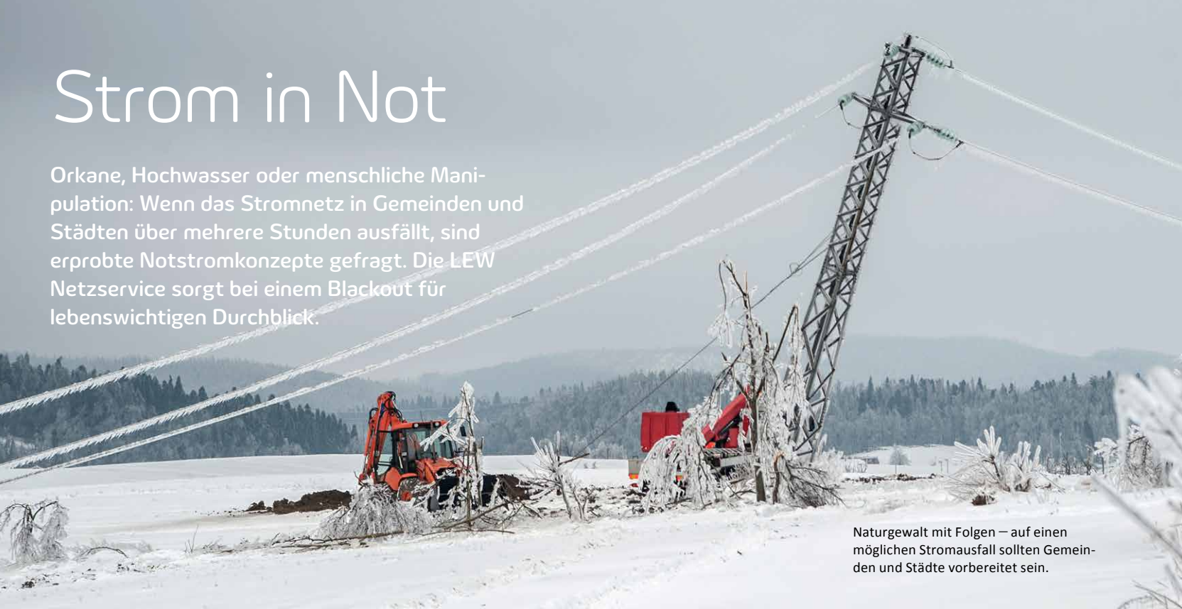
Naturgewalt mit Folgen – auf einen möglichen Stromausfall sollten Gemeinden und Städte vorbereitet sein.

Orkane, Hochwasser oder menschliche Manipulation: Wenn das Stromnetz in Gemeinden und Städten über mehrere Stunden ausfällt, sind erprobte Notstromkonzepte gefragt. Die LEW Netzservice sorgt bei einem Blackout für lebenswichtigen Durchblick.